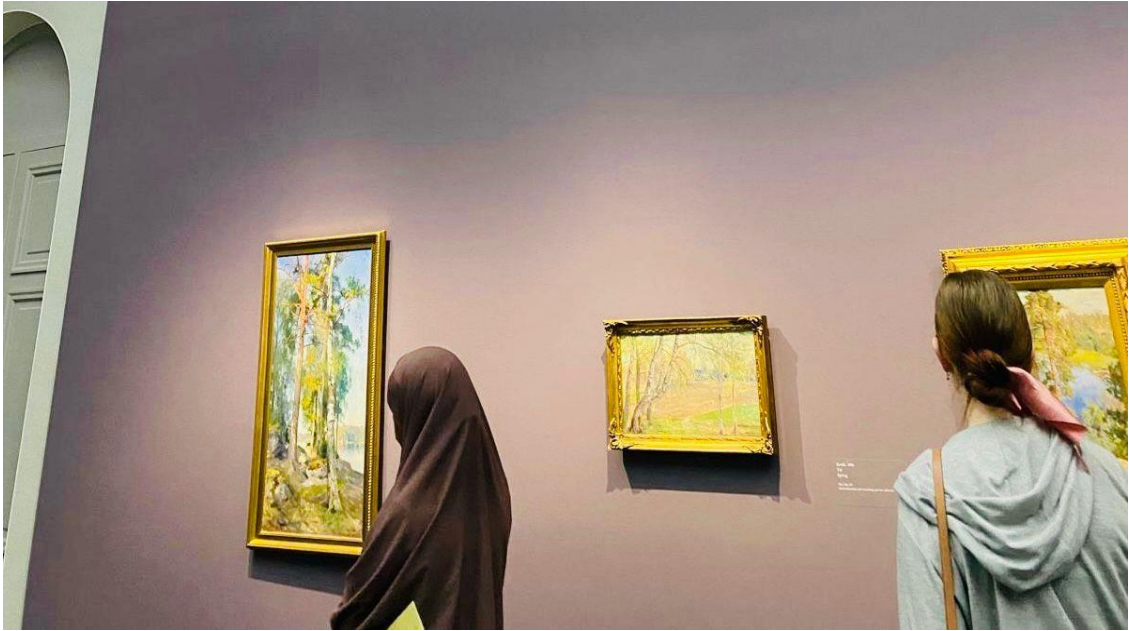
Opiskelijat vierailivat taidemuseo Ateneumissa 19.4.2024

Opiskelijakunnan hallitus toteutti toivottuja retkiä, joita olivat kaksi Fazer-käyntiä perjantaina 29.9. ja perjantaina 8.3. sekä vierailu Ateneumin taidemuseossa perjantaina 19.4. Opiskelijakunnan hallituksen toiveesta suunniteltiin myös mahdollisia syyslukukauden sekä kevätlukukauden päätösjuhlia, jotka päädyttiin siirtämään seuraavaan lukuvuoteen.