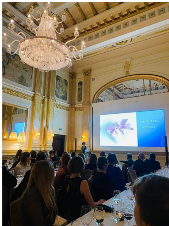
Koko koulun henkilöstön yhteinen pikkujoulujuhla Kämpin peilisalissa 9.12.2023