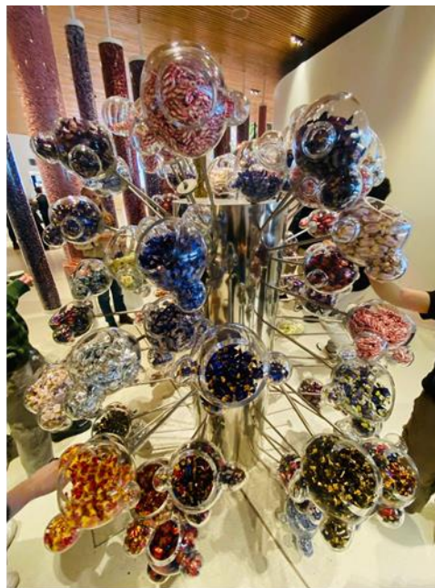
Opiskelijat vierailulla Fazer Visitor Centerissä.