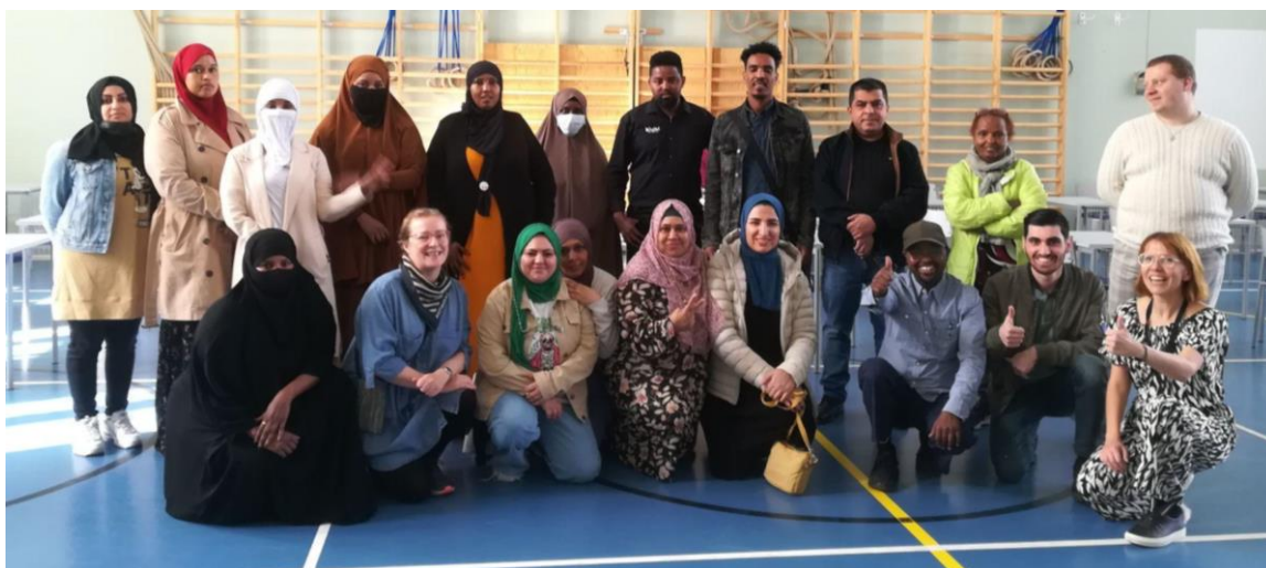
Syksyn ryhmäytymispajassa tuutoreita sekä uusia opiskelijoita.