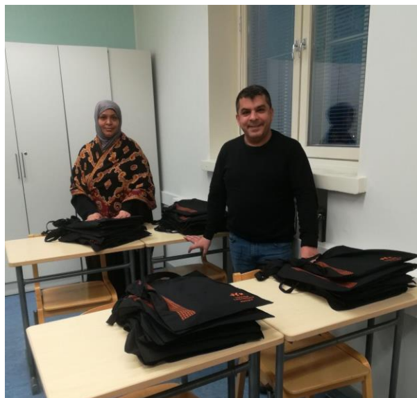
Tutorit valmistivat opiskeluvälinepaketteja uusille ryhmille.

uusia aloittavia ryhmiä syksyn alkuinfossa ja ensimmäisinä koulupäivinä sekä muutokin tarvittaessa. Lisäksi tutorit ja ohjaava opettaja järjestivät uusille ryhmille perinteisen ryhmäytymispajan opintojen alussa syys- ja kevätlukukaudella. Ryhmäytymispajassa uudet opiskelijat tutustuivat toisiinsa ja tutoreihin erilaisten leikkimielisten tehtävien avulla. Tutorit saivat tutortoimintaan osallistumisesta kurssisuorituksen (ot3 Tutor-kurssi) ja todistuksen valmistumisen yhteydessä.